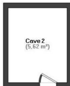
— Sous-sol —